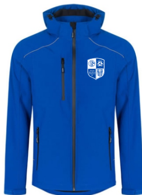
Art. Nr. E7850 Men's Softshell Jacket