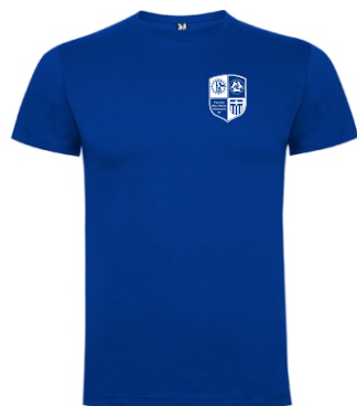
Art. Nr. RY6502 Men's Dogo Premium T-Shirt