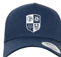
Art. Nr. FX7707 5-Panel Curved Classic Snapback