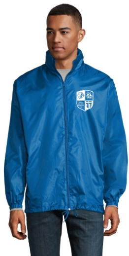
Art. Nr. L01618 Shift Windbreaker