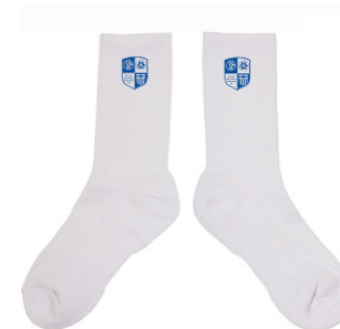
Art. Nr. By201 Crew Socks

Pader Textil Design Karl-Schurz-Str. 54 33100 Paderborn