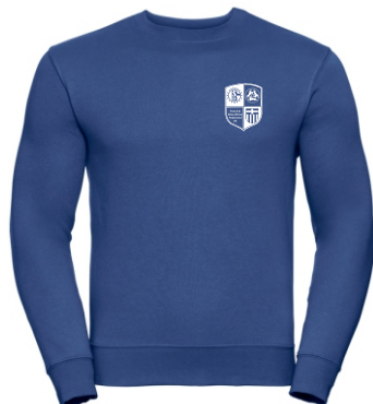
Art. Nr. Z267M Authentic Sweat Jacket