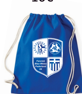
Art. Nr. Wm110 Cotton Gymsack